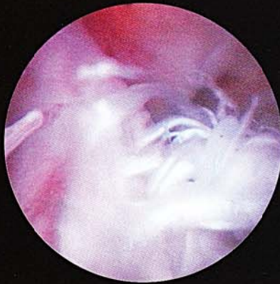
断裂した前十字靭帯