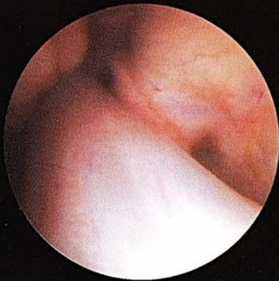
正常の前十字靭帯