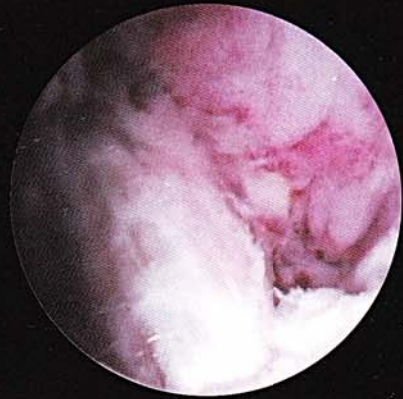
再建した前十字靭帯