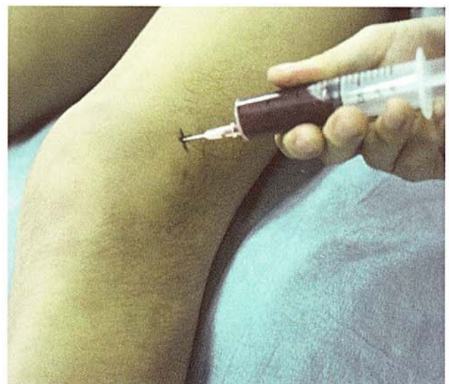
膝にたまった血液をぬいているところ