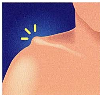
鎖骨遠位端の突出