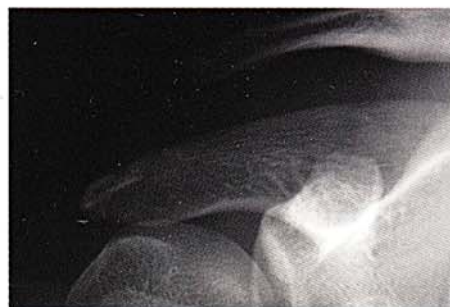
肩鎖関節脱臼のX線像