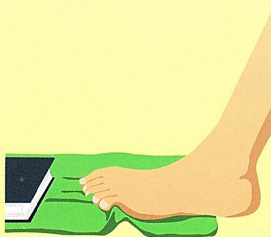
タオルギャザー(足底の筋肉の強化)