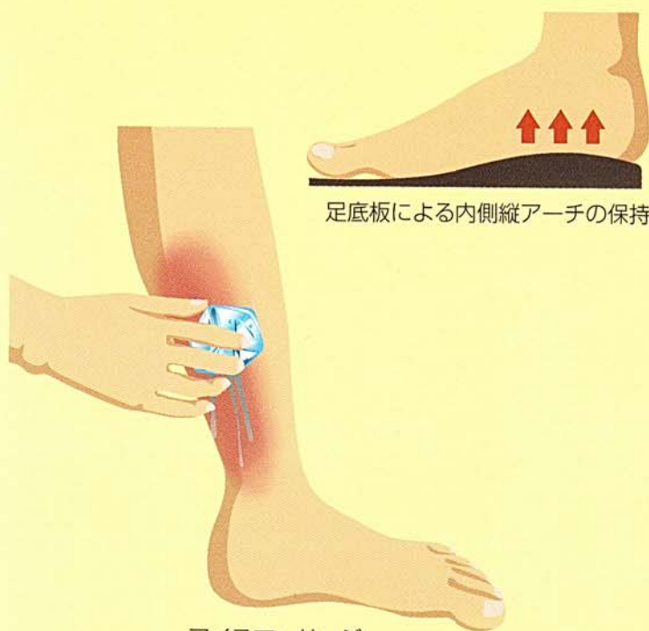
アイスマッサージ

痛みが強い場合は慢性化を避けるために運動量を減らす必要があり、アイスマッサージや外用薬の使用、足底や足関節周囲の筋肉の強化やストレッチを行います。足底板も効果的で、クッション性が良くかかとの安定したシューズを選ぶことも重要です。