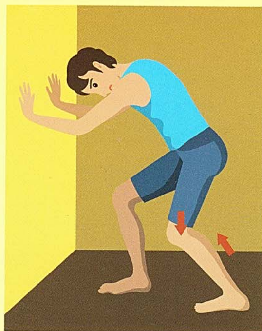
ヒラメ筋のストレッチ(膝を曲げる)