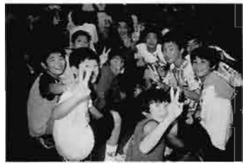
加者・関係者のみなさん「初体験」大変ご苦労さまでした。

みのよい思い出」となったようである。最後にこれからに向けて、今回の事業を振り返って見ると、事業内容の異なる二つの事業を同時に行うという「大きな課題」を持って開催され、「活動プログラム・指導体制」にそれぞれの内容にあったものが要求されていた。しかし、ある程度の予想はしていたものの、初めてということもあり、その要求を満たすことは今回の事業だけでは難しく、様々な検討課題を残すこととなった。そんな中ではあったが、中学生と小学生が同時に活動する中で付加価値的に生まれた「新たな財産」もみられたので、大事にして行きたいところである。参加者・関係者のみなさん「初体験」大変ご苦労さまでした。