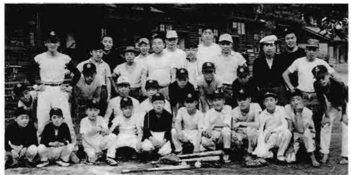
真室川少年ジャイアンツスポーツ少年団 (最上支部)