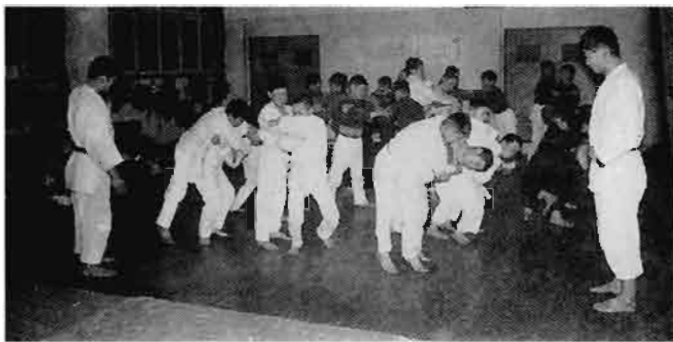
おもたか柔道スポーツ少年団 (村山支部)