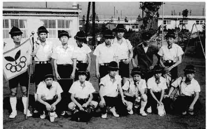
第2回全国スポーツ少年大会に参加した余目町スポーツ少年団員

山形県にスポーツ少年団が芽生え、創設されてから四十年を迎えました。心から慶賀いたします。今では、全国に誇れる組織にまで発展、充実してまいりました。関係した先人、先輩の方々の先見の明と熱意に心から敬意を表するものであります。 事務局からの報告によりますと、平成十四年度に登録された、団員、団数が前年度より増加しているとのことでした。今日の少子化社会にあつて、増加しているということは、スポーツ少年団に対する地域社会の期待の大きさを反映したものと考えます。ご承知のように、スポーツ少年団は、団員、指導者、そして、リーダーや、母集団で構成される、他に例のない磐石な集団であります。更に、教育委員会や、体育協会(各種競技団体)学校や、地域等より、力強く支えられています。この大きな力が、地域スポーツ発展の原動力となり、四十年間で培った信頼と期待に応える事が肝要かと思えます。 今後とも一層のご指導、ご協力をお願い申し上げます。