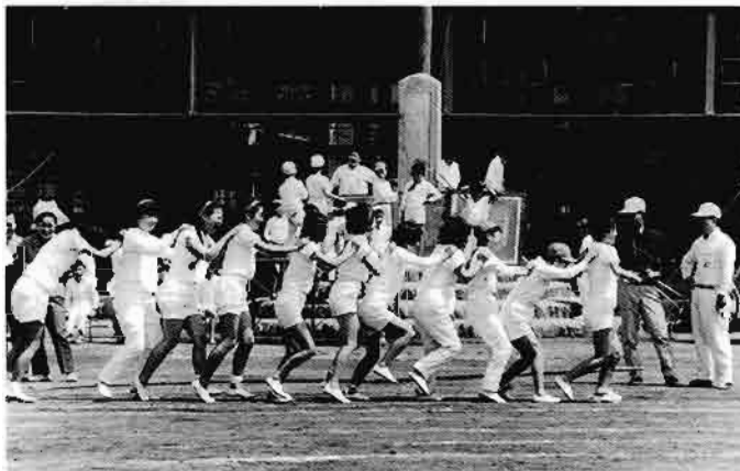
吉島地区スポーツ少年団のレクリエーション活動 (置賜支部)